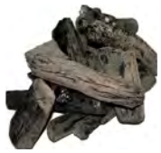
炭（5 人から 7 人分）