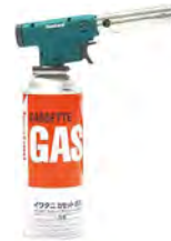
着火用ガスバーナー